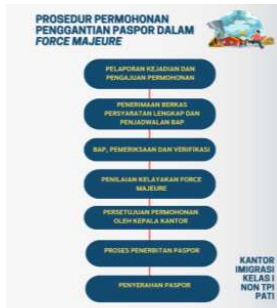
Gambar 3.1 Prosedur Permohonan Penggantian Paspor dalam Force Majeure di Kantor Imigrasi Kelas I Non-TPI Pati

akuntabilitas serta mencegah penyalahgunaan (Agista, Wulandari, & Sukaris, 2023).